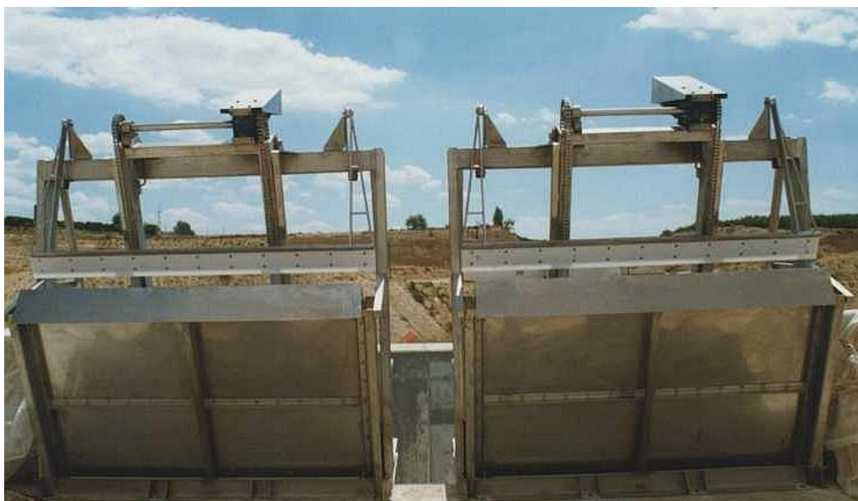
Vista posterior de ambas máquinas.