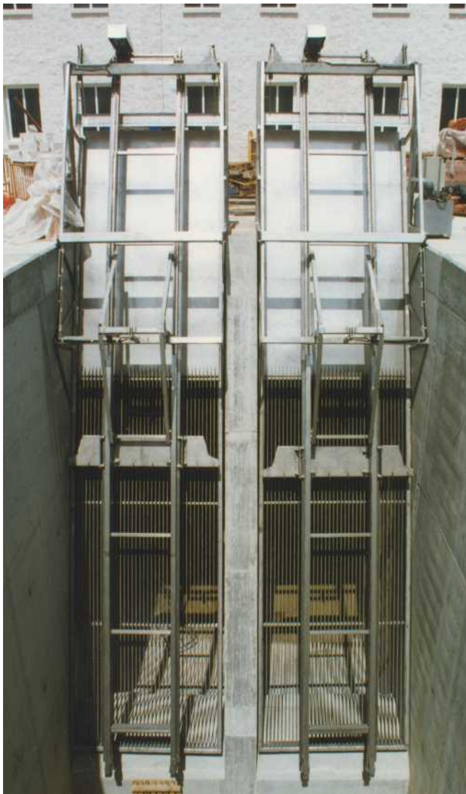
Vista frontal de las máquinas; 5.000 kg. de acero inoxidable mecanizado y soldado, cada fabricado.