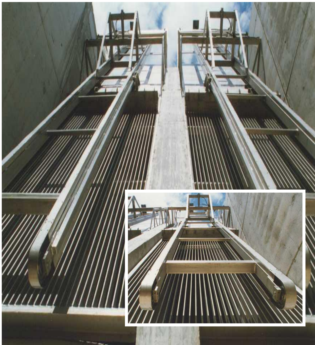
Se aprecian las guías donde están ubicadas las cadenas que ejecutan el movimiento ascendente y descendente.