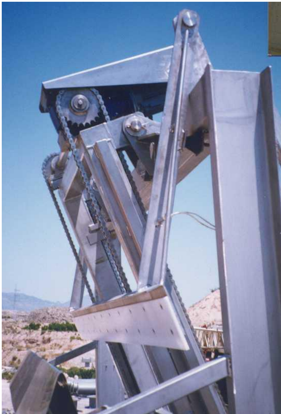
Vista del limpia-peine en su posición de reposo.