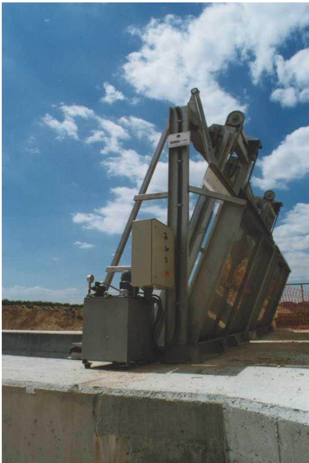
Vista lateral de las máquinas, dónde se aprecia el cuadro eléctrico de mando y central hidráulica.